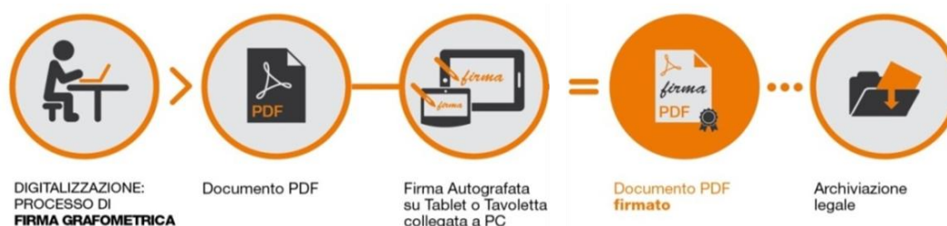
Fig.2 - Schema

I dati cifrati vengono successivamente inseriti nel pdf attraverso la creazione di una firma conforme allo standard europeo denominato PAdES. La soluzione prevede che, a sigillo di ogni firma apposta sul documento dal CLIENTE, sia applicato un certificato rilasciato da NAMIRIAL CA.